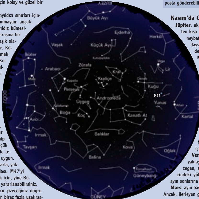
1 Kasım saat 23:00, 15 Kasım saat 22:00, 30 Kasım saat 21:00'de gökyüzünün genel görünümü.

Mars, ayın başında 22:00 civarında doğuyor. Ancak, ilerleyen günlerde gezegen hızla yükselimi artırıyor ve ay sonunda alacakaranlıktan kısa bir süre sonra doğuyor.